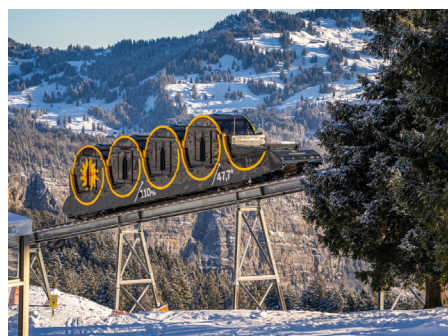
Treib mit Uw gegen Mythen hoch

Nun heißt es Abschied nehmen. Aber vorher, erfahren wir noch geschichtliches, interessantes und wissenswertes über unseren Urlaubsort Luzern. Nach einer kurzen individuellen Mittagspause verlassen wir die Vierwaldstätter See-Region und fahren mit dem Zug zurück nach Basel (SBB). Der Reiseleiter verabschiedet die Gruppe gegen 14.00 Uhr am Bahnhof Basel SBB und wünscht eine angenehme Heimreise.