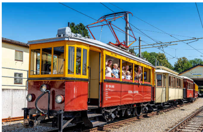
Traunseetram Sonnenblumen