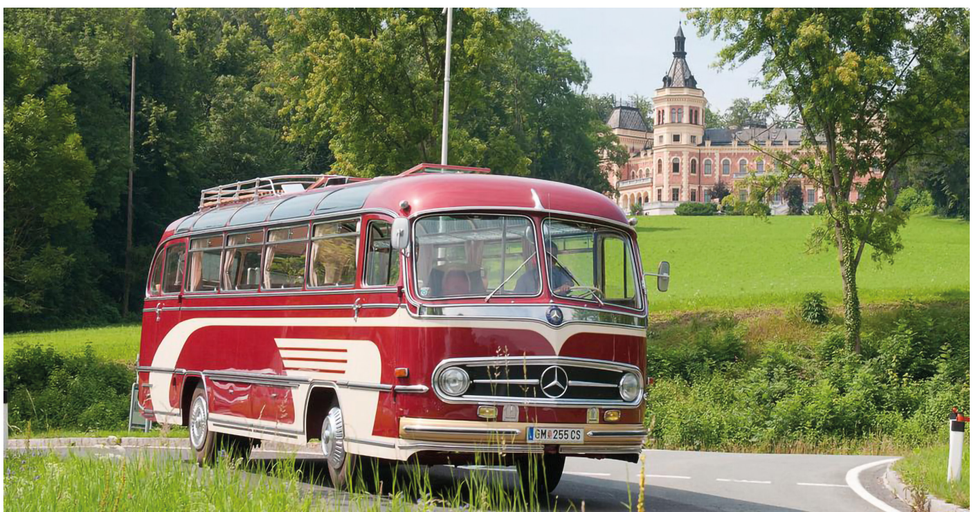
Oldtimer vorn Ansicht